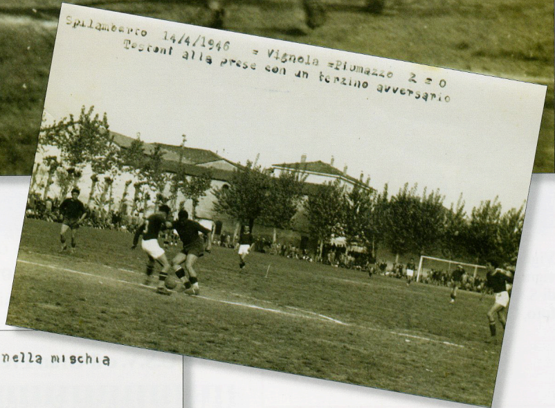
Spilimbergo 14/4/1946 = Vignola - Piumazzo 2-0 Trentini alla prese con un terzino avversario