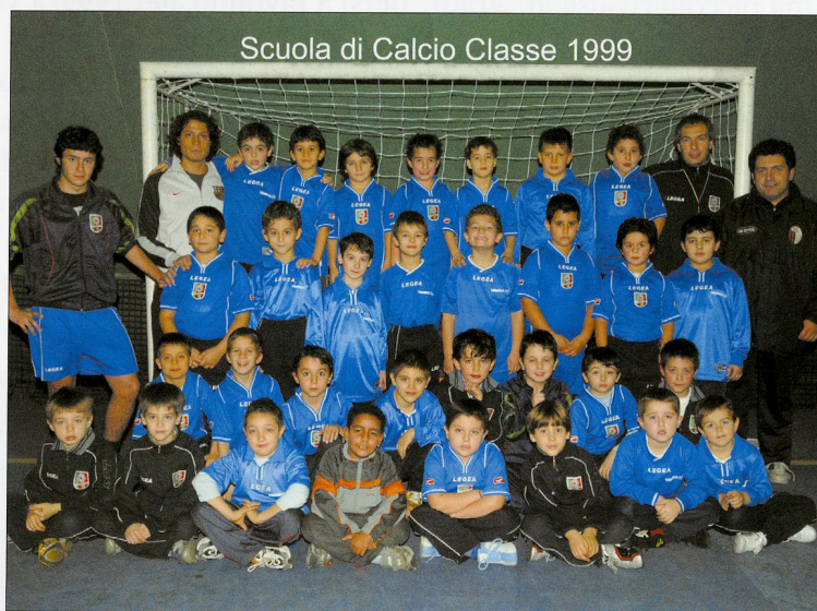
Scuola di Calcio Classe 1999