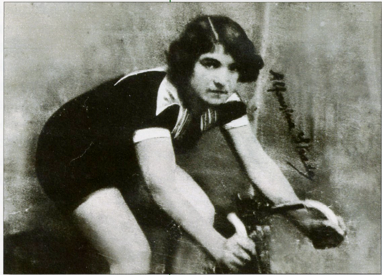
1920? Alfonsina Strada, la velocipedista nata a Castelfranco Emilia.