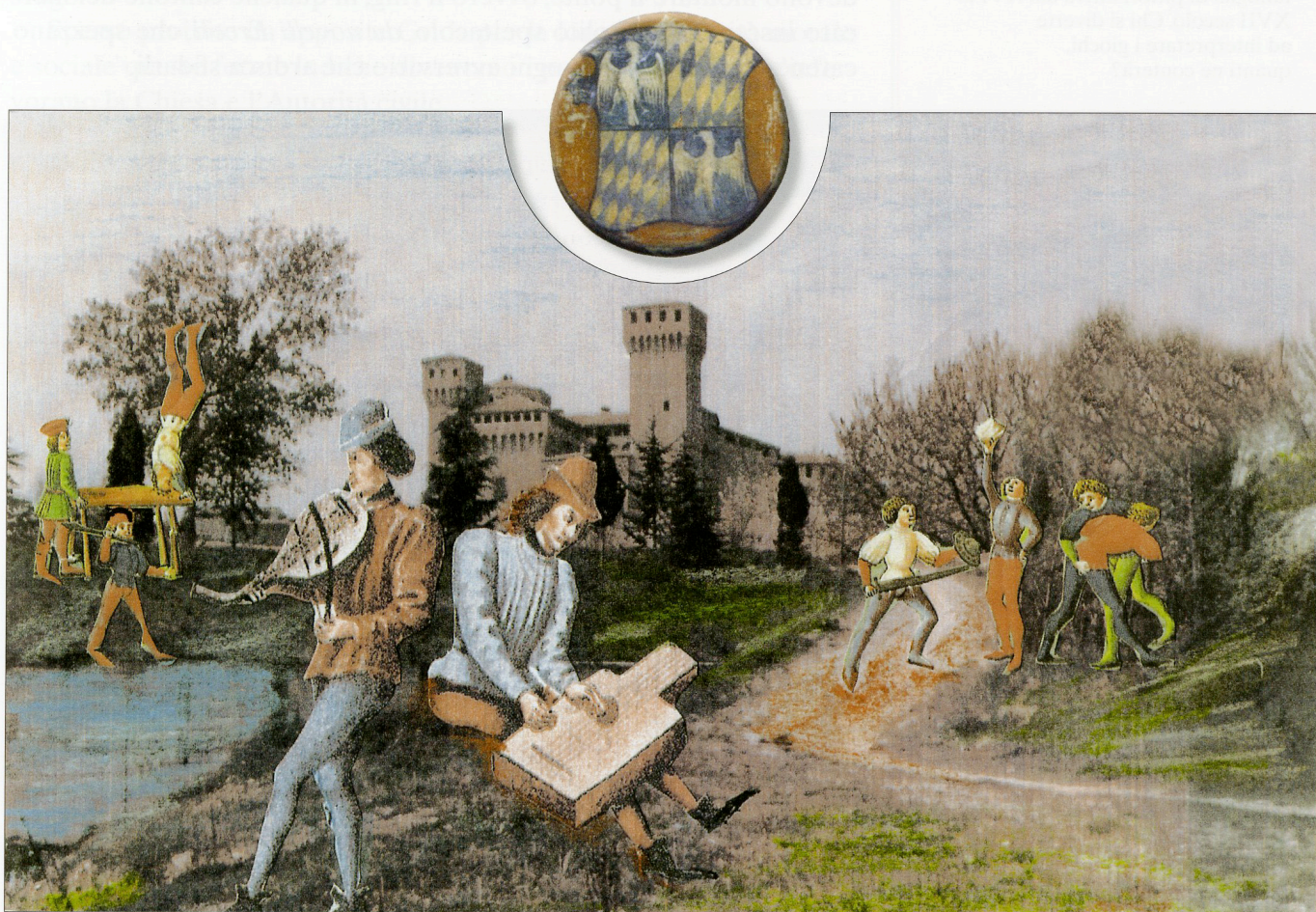
Trovieri ed acrobati avanti alla rocca di Vignola. Lo stemma è quello dei Contrari investiti del feudo nel 1401.